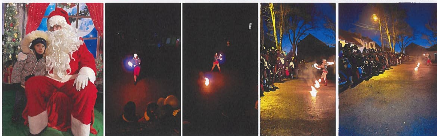
Un Père Noël généreux qui a offert des chocolats à tous les enfants du village (âgés de -10 ans)